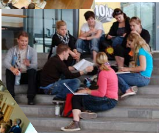
Taktiksnack i trappan.

Fullsatt under lunch. Fumlaren diggar även kosten idag.