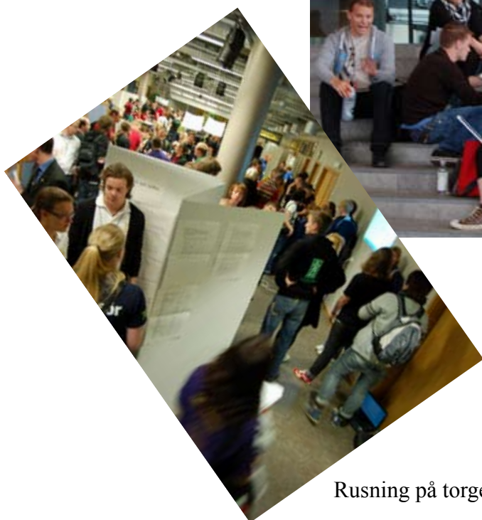
Rusning på torgen.